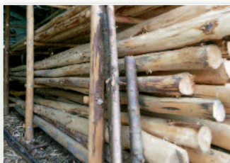
Fertig geschälte Rundhölzer